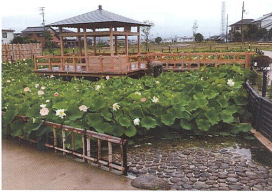
舞妃蓮が池一面に咲き誇っています。 (見ごろ6月から8月)