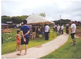
毎年観蓮会を開催しています。