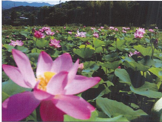
大賀蓮が池一面に咲き誇っています。 (見ごろ6月から7月)