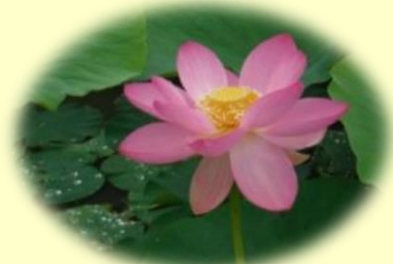
大賀蓮 (2 千年蓮)

御坊市藤田町吉田出身の阪本祐二氏が「大賀蓮」と「王子蓮」を掛け合わせて作出。 花の閉じる姿が優雅さを備えることから皇室献上の年、昭和 43 年舞妃蓮と名付ける。