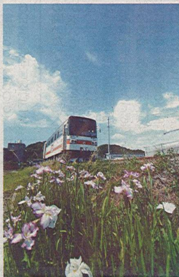
権神さんの「菖蒲の花が咲く頃」