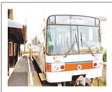
市民や多くの鉄道ファンに愛される紀州鉄道。バスのような外観が可愛いと評判