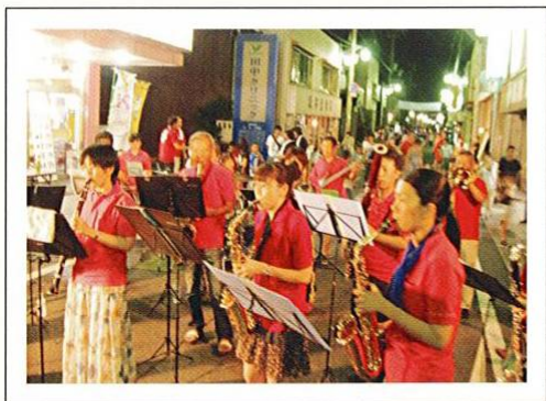
夏祭りで盛り上がる御坊商店街

昨年10月からこの取り組みを始めたところ、話題を集め目に見えて訪れる人が増えました。驚きはこれだけではありません。全国に1万以上の商店街があるなか、この取り組みは、経産省の「がんばる商店街30選」に選定されることになったのです。実はこうした「補助金に頼