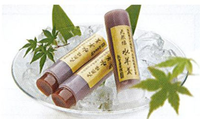
天然塩水羊羹 有限会社紅葉屋本舗